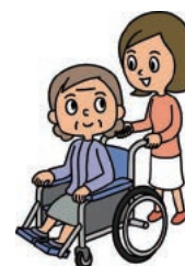
親介護保障特約 など

傷害保障〈Myセーフティ〉と個人賠償責任特約を組み合わせることで、自転車事故の際には自身のケガだけでなく、相手への高額な賠償にも備えることができます。