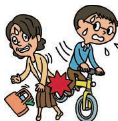
個人賠償責任特約