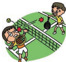
レジャー中のケガ